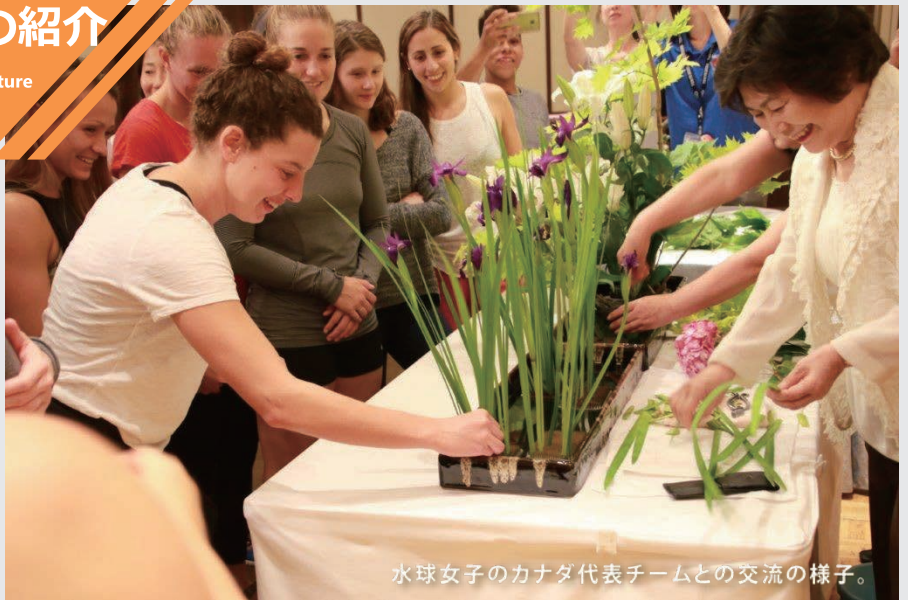
水球女子のカナダ代表チームとの交流の様子。